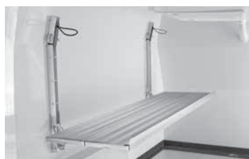
Wegklapbare rekken aan de zijkanten