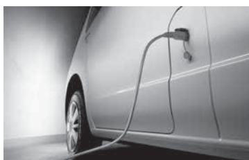
Standaard 220V A/C-stroomaansluiting aan de linkerzijde met kabels

● Standaard / ○ Optie / - Niet Beschikbaar / P Pack