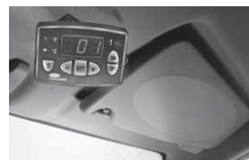
Temperatuur controle unit